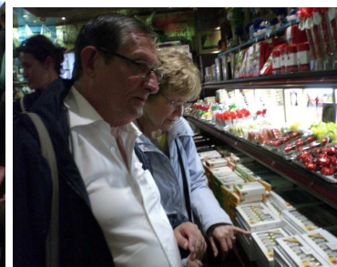
Wer die Wahl hat....

Es blieb natürlich auch noch ein wenig Zeit für die Schönheiten der alten Hansestadt an der Trave.