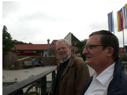
Seebären im Smalltalk