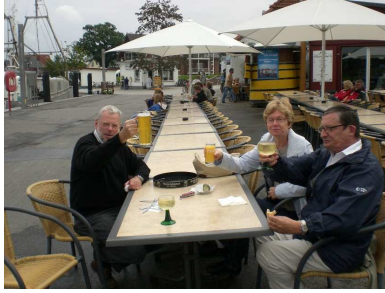
Na denn Prost