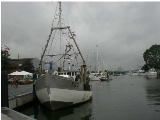
Fischkutter sichert den Nachschub