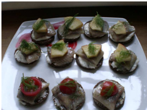
Ein kleines Amuse Guele

Für den Abend hatte ich eine kleine Familienfeier organisiert.