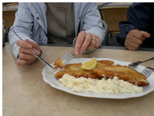
Lecker Dorsch mit Mayosalat