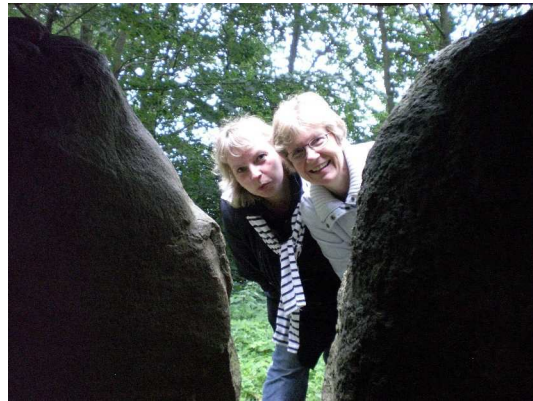
Il y a quelqu'un?