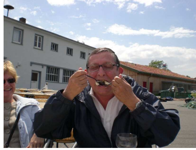
Zwei Gabeln= Gourmand? Clémentine, oder ?