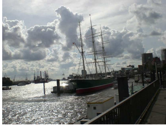
Die Rickmer Rickmers