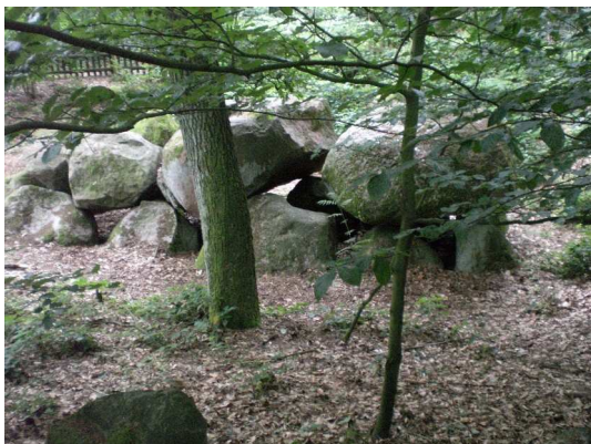
Das ist es!