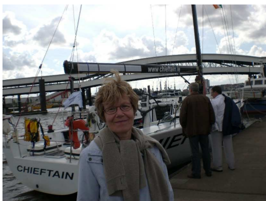
Im City Sportboothafen