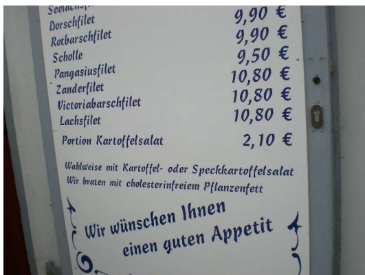
Gott sei Dank! Cholesterinfreies Fett!