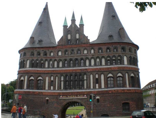
Holstentor, frisch renoviert

Es blieb natürlich auch noch ein wenig Zeit für die Schönheiten der alten Hansestadt an der Trave.