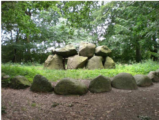
Auf einer Lichtung gelegen