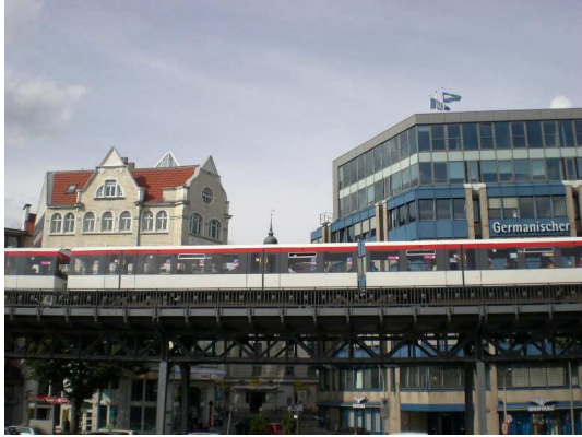
U- Bahn am Baumwall