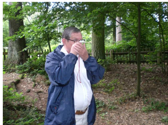
Mit optimaler Ost- Westausrichtung