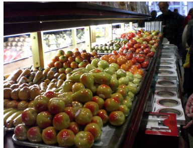
Alles echt! Marzipan!