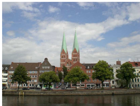
St. Marienkirche und die Trave