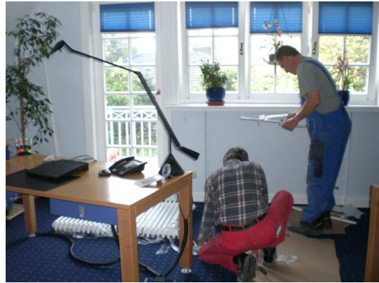
Arbeitszimmer mit neuem Heizkörper