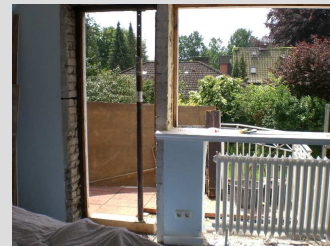
Blick aus Arbeitszimmer