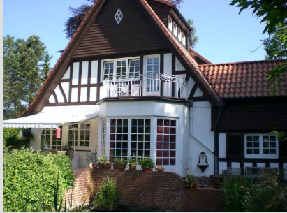
Hier war die Welt noch in Ordnung

Die Zimmerleute fallen ein am Donnerstag, den 31.5.07 um Punkt 7.00h, pünktlich wie die Maurer also und bauen in Windeseile das Gerüst auf. Die erste Fuhre mit Eichenbalken wird dann gegen 8.30h laut polternd abgeladen. Wie fleißige Ameisen wuseln die Handwerker umher.