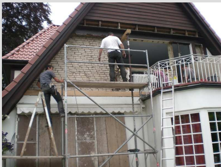
Nun ganz „nackig“