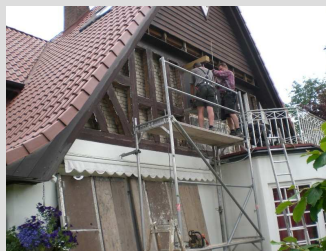
und jetzt entfernt