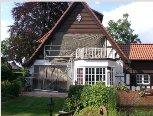
Donnerstagabend, nach Feierabend