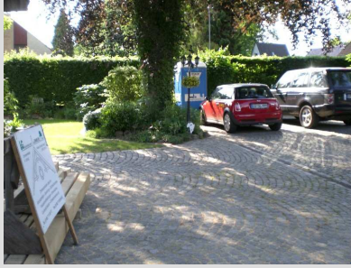
Auch wichtig, das stille Örtchen ( hinterm Mini!)

Am Freitag geht es dann wieder zur Sache, es wird geklotzt und auch gekleckert...Die alten Balken werden entfernt und die neuen zu recht gesägt und gehobelt und dann auf den Balkon gehievt und eingepasst.